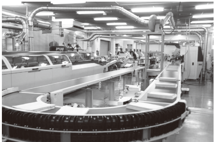
荒川区内にプリプレス～ポストプレスの一貫工程を完備

印刷と製本の工程が隣接し連動していることには、さまざまなメリットが見出せる。1折の前に付きものがある、あるいは最後の台に貼り込みがあるなどのケースでは、所定の台を先に印刷するといった柔軟な対応は可能だ。あるいは乾燥に時間を要する用紙を先に印刷する、