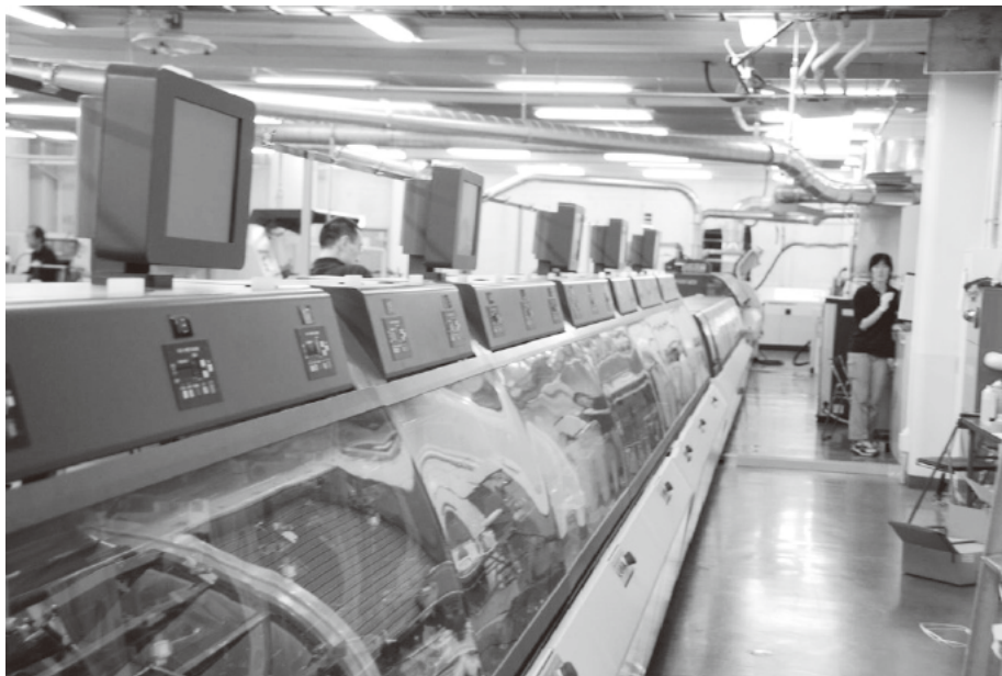
品質保証を満足させる生産体制を実現

といった対応だ。こうした工程間の調整は、現在は部分的に行っているが、最終的に原稿が入ってから最終工程までの一貫した流れをシステム化するレベルを目指す。